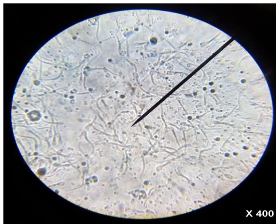
Document : Dissection de testicule de mouton, protocole de prélèvement de pulpe testiculaire et spermatozoïdes au microscope.